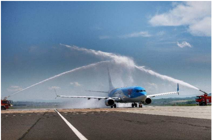
M-SEC 002-00 Livret accueil entreprises extérieures