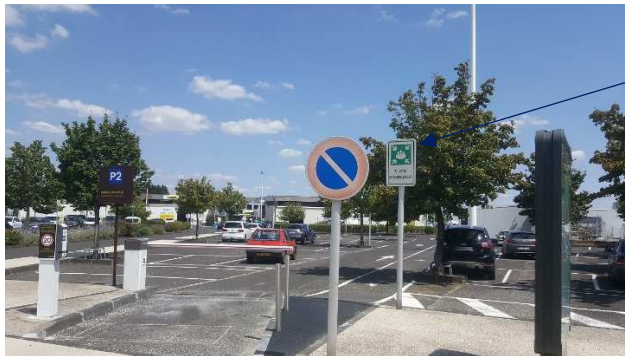
Point de rassemblement côté ville