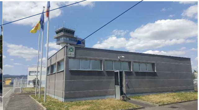
Point de rassemblement côté piste